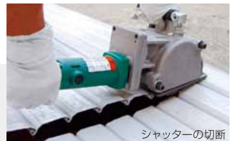
シャッターの切断